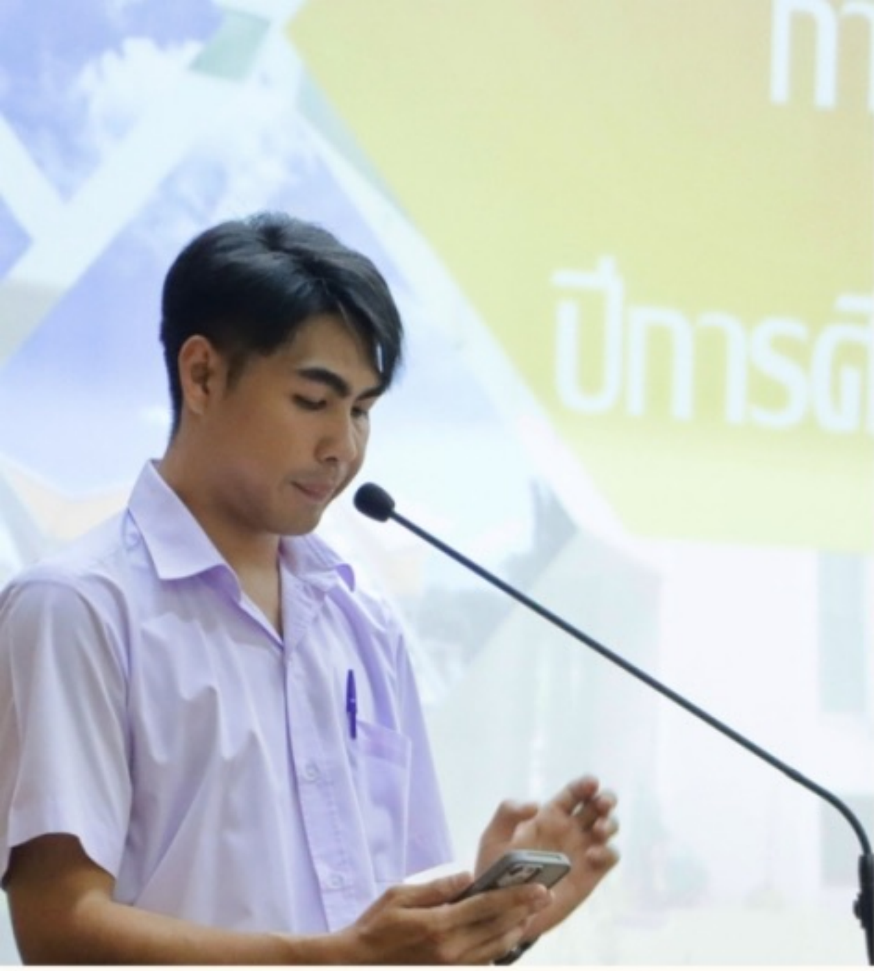
ประมวลภาพ