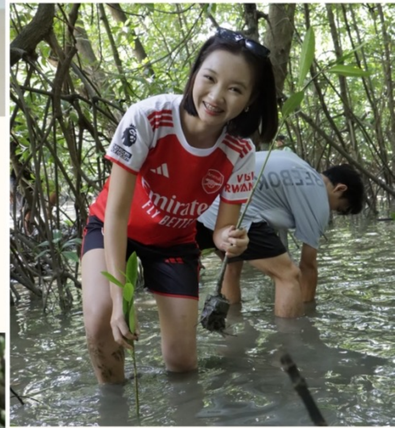
ภาคเรียนที่ 2